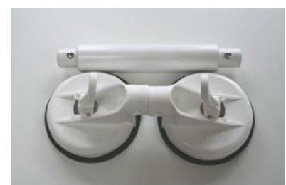
Immer dabei: ausgeklipst = Taschenformat